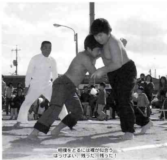
相撲をとるには裸が似合う はっけよい、残った、残った!

二月十三日(日)、 平田火鎮祭廿日相撲保 存会(会長・木村忠男) はゆめタウンの駐車場 で平田火鎮(ひぶせ) 祭廿日相撲大会を開催 しました。 この日は風もなく穏 やかで、相撲を取る人 や観る人に絶好の日和 りとあって多くのひと が相撲を賑に集まりま した。 平田火鎮廿日相撲は 毎年二月の中旬に開催 されますが、平田地区 に火事が起こらない様 にお願いを込めて神様 に奉納したのが始まり で、それが今に受けつ がれているものです。