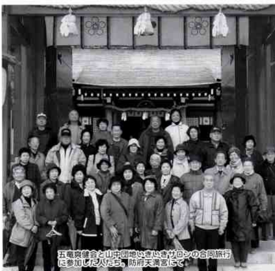
五竜爽健会と山中団地のいきいきサロンの合同旅行に参加した人々、防府天満宮にて

「岩国市健康づくり計画」が策定され、基本方針のキヤッチフレーズができました。『いきいき、わくわく、にっこり』岩国。生活を楽しく体力アップ、朝食をおいしく食べることを、わくわくと「朝食を楽しく」をテーマに料理教室を行いました。献立は米飯