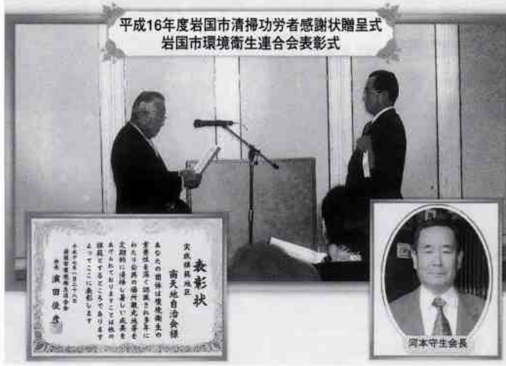
平成16年度岩国市清掃功勞者感謝状贈呈式 岩国市環境衛生連合会表彰式