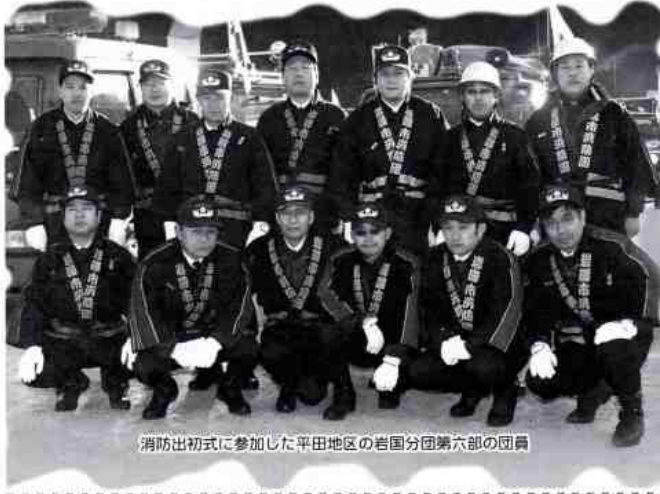
消防出初式に参加した平田地区の岩国分団第六部の団員

発行所 平田地区社会福祉協議会 ひらた新聞編集部 (岩国市平田出張所内) 岩国市平田3丁目22-18 印刷所 フジ美術印刷株式会社 岩国市今津町2丁目2-52