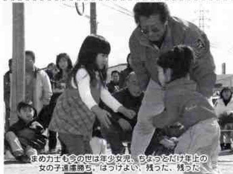
まめ力士も今の世は年少女児、ちよつとだけ年止の女の子遠慮勝ち、はっけよい、残った、残った