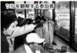
参加者を観察する 五竜爽健会・山中団地 いきいきサロン合同旅行

梅の香に誘われて防府天満宮・国分寺・八代盆地のナベツル観察に、岩国市営バスの貸切りで出かけました。気温は低めのこの日の午後は、雨模様となりましたが、旅行にはあまり影響はありません。